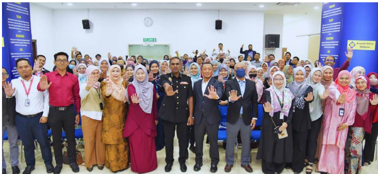
Sambutan Hari Antirasuah Antarabangsa (HARA) 2023 peringkat Koop Sahabat.